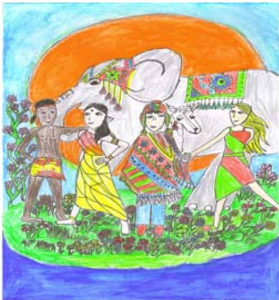
Εικόνα 1 Ζωγραφίζει η Μάγια κούχτιν

Η ΦΙΛΙΑ ΔΕΝ ΕΧΕΙ ΟΡΙΑ.....ΜΠΟΡΕΙ ΝΑ ΚΡΑΤΗΣΕΙ ΑΙΩΝΕΣ.....ΑΝ ΤΟ ΘΕΛΟΥΜΕ ΦΥΣΙΚΑ...!!!!